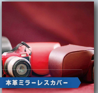
本革ミラーレスカバー