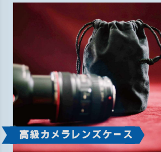
高級カメラレンズケース