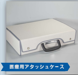
医療用アタッシュケース